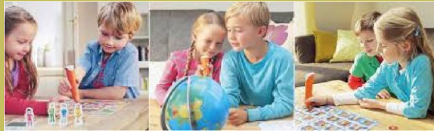
spielerisch Deutsch lernen